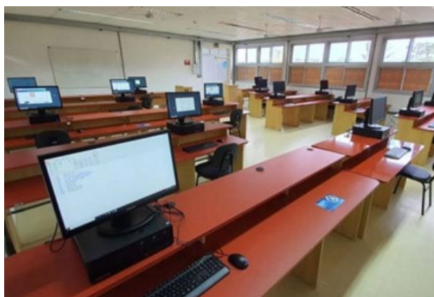
Figura 5 – Laboratório de Sistemas I – Unidade Bom Princípio.

Além dos laboratórios de informática, os estudantes têm acesso ao Espaço de Aprendizagem Colaborativa (Figura 6), no qual são organizadas atividades de estudo auxiliadas por monitores.