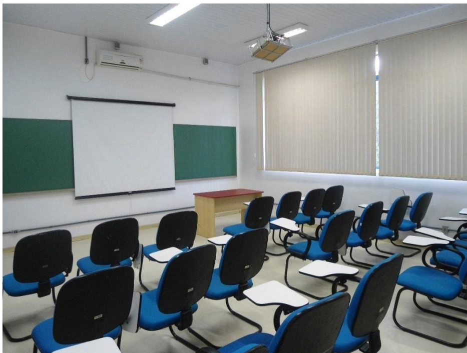
Figura 2 – Uma das salas de aulas da Unidade Cidade Alta.

No complexo da Cidade Alta estão disponíveis 4 salas de aulas (Figura 2), equipadas com aparelhos multimídia e condicionamento de ar. Duas delas encontram-se no pavimento térreo e as demais, construídas no segundo pavimento da edificação.