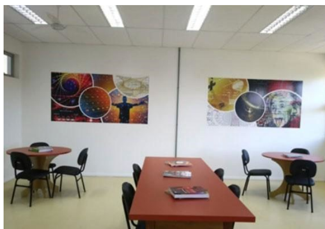
Figura 6 – Espaço de Aprendizagem Colaborativa – Unidade Bom Princípio.

Além dos laboratórios de informática, os estudantes têm acesso ao Espaço de Aprendizagem Colaborativa (Figura 6), no qual são organizadas atividades de estudo auxiliadas por monitores.