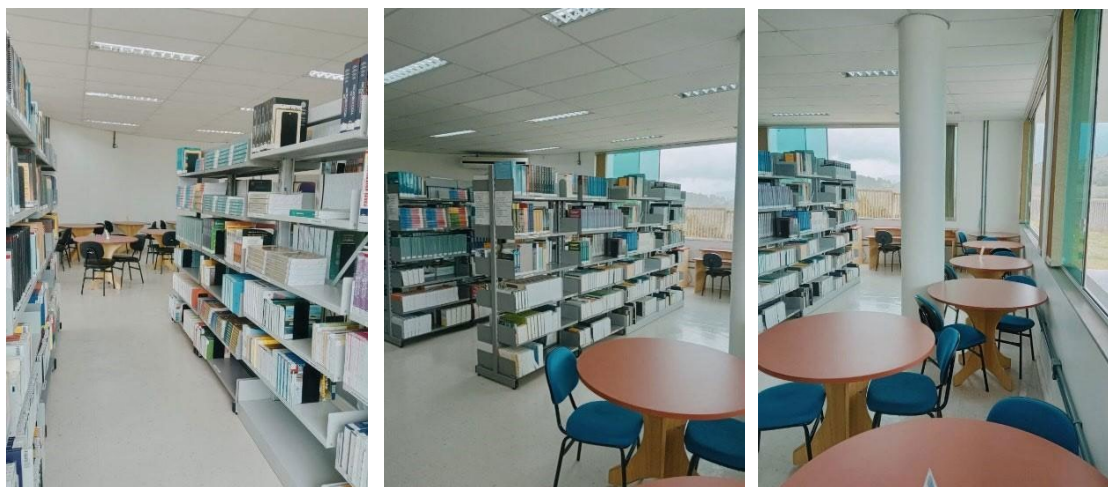
Figura 4 – Fotos da Biblioteca Setorial Campus FURG-SAP – Unidade Bom Princípio.

( https://servicos.furg.br/servicos/periodicosrt/ ). Todos os livros são tombados e registrados junto ao patrimônio da FURG, catalogados e disponibilizados no Sistema de Bibliotecas, por meio do seu catálogo ARGO (disponível em: https://argo.furg.br/ ). Por meio do sistema é possível realizar consultas ao acervo, reserva de itens e renovação dos itens emprestados.