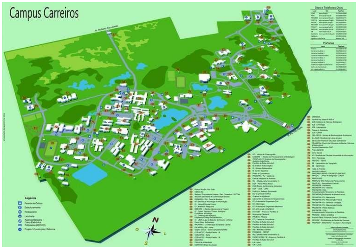
Figura 3 - mapa ilustrativo do Campus Carreiros (2016)