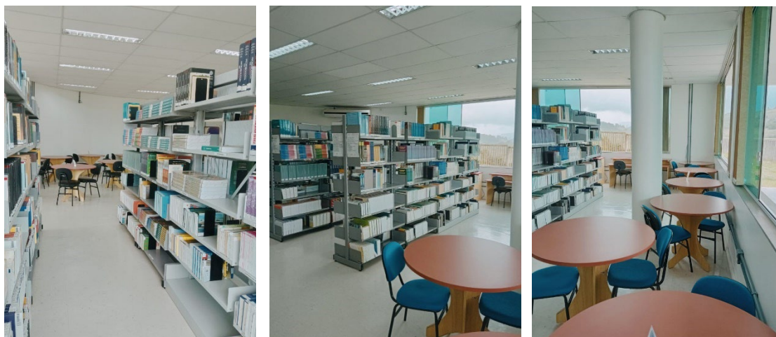
Figura 4 – Fotos da Biblioteca Setorial Campus FURG-SAP – Unidade Bom Princípio.

( https://servicos.furg.br/servicos/periodicosrt/ ). Todos os livros são tombados e registrados junto ao patrimônio da FURG, catalogados e disponibilizados no Sistema de Bibliotecas, por meio do seu catálogo ARGO (disponível em: https://argo.furg.br/ ). Por meio do sistema é possível realizar consultas ao acervo, reserva de itens e renovação dos itens emprestados.