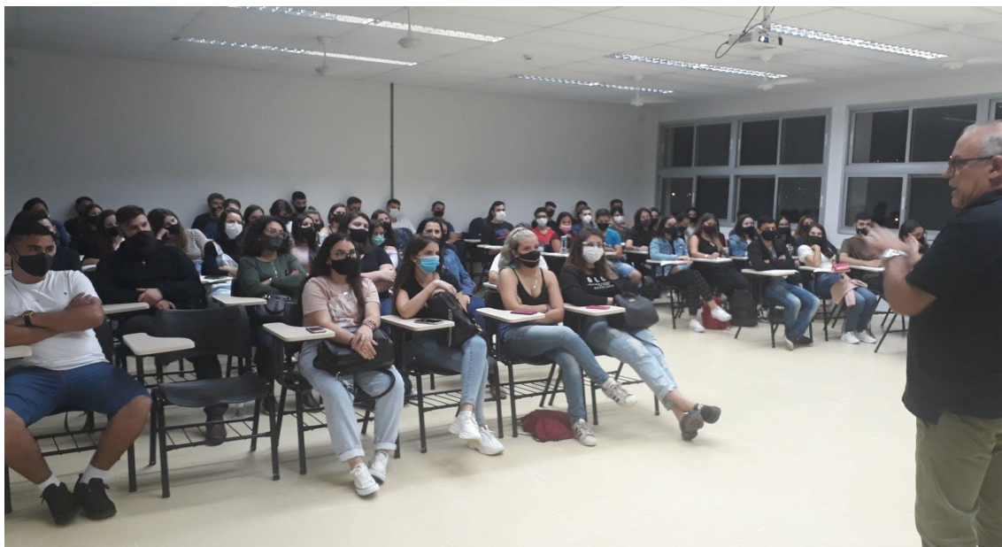
Figura 3 - Início do ciclo letivo de 2022-1 - Sala de aula na Unidade Bom Princípio da FURG-SAP

e março de 2022. Em abril de 2022 foram retomadas as atividades presenciais, sendo realizadas prioritariamente na Unidade Bom Princípio (Figura 3).